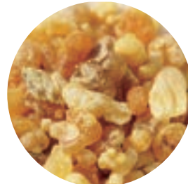
フランキンセンス