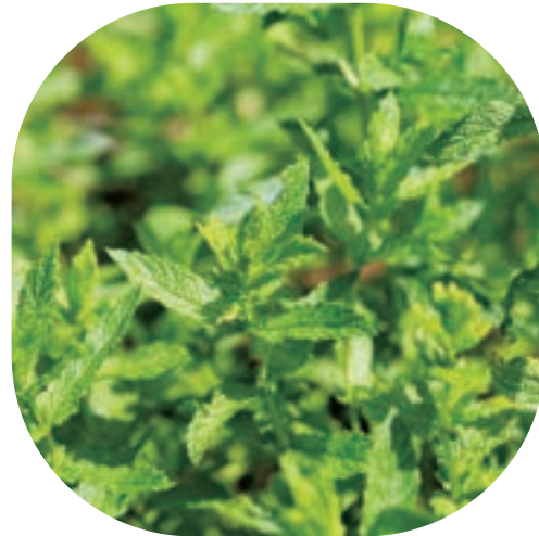
Lime/Spearmint/Peppermint/Lemon-grass/Juniper berry/Cedarwood ライム/スペアミント/ペパーミント/レモングラス/ジュニパーベリー/シダーウッド