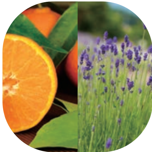
Lavender/Sweet orange/Bergamot/Petit-grain/Eucalyptus radiata/Sandalwood ラベンダー/スイートオレンジ/ベルガモット/プチグレン/ユーカリラジアータ/サンダルウッド