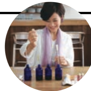
IFAアロマセラピスト アロマスペースデザイナー

朝の海辺を散歩していると、陽光と潮風が新しい一日の活力をもたらしてくれます。どこまでも広がる海と朝の陽射しの清々しく明るい空気をイメージした香りです。思考をすっきりとさせて覚醒する爽やかなミントの香りに、きらりと輝くライムの香り。ジュニパーベリーは針葉樹らしい瑞々しさを精神を健やかにするだけでなく、遠い夏のジントニックの香りに重なるかもしれません。シダーウッドの深く甘みのある香りが呼吸を深くします。ゆったりと朝のエネルギーを深呼吸して、一日をスタートしましょう。