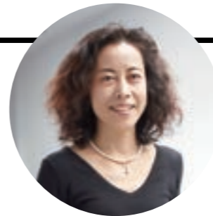
フラワーデザイナー&スタイリスト

お花は毎月変わるためお花そのもののご紹介は出来ませんが、デザイナーさんをご紹介することで、そのお花を身近に感じて欲しいなと思っています。